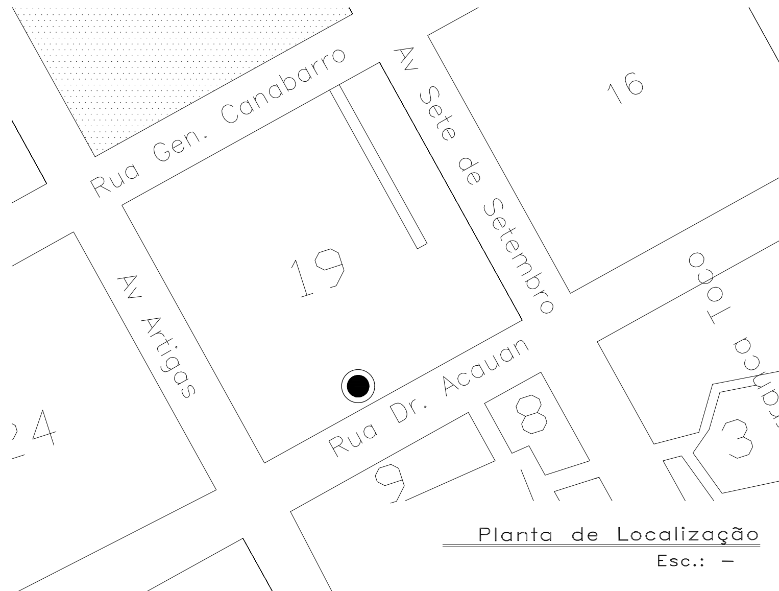
Planta de Localização Esc.: —